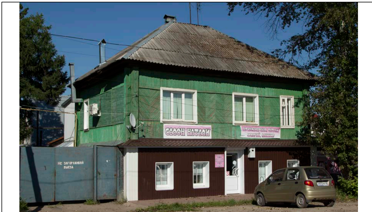
Фото 1. Тамбовская область, г. Моршанск, ул. Евдокимова, 22. «Дом жилой». Общий вид с запада. Фото от 26.07.2017 г.