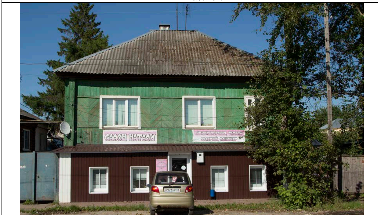
Фото 2. Тамбовская область, г. Моршанск, ул. Евдокимова, 22. «Дом жилой». Общий вид с северо-запада. Фото от 26.07.2017 г.