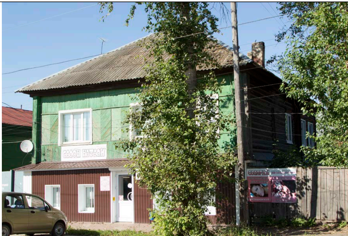
Фото 3. Тамбовская область, г. Моршанск, ул. Евдокимова, 22. «Дом жилой». Фрагмент главного фасада, вид с юго-запада. Фото от 26.07.2017 г.