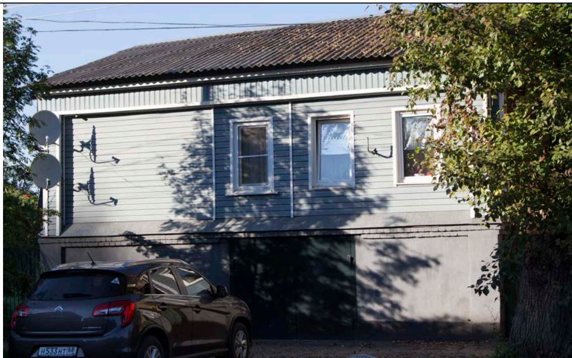
Фото 2. Тамбовская область, г. Моршанск, ул. Красноармейская, 10. «Дом жилой». Главный фасад с юго-запада.