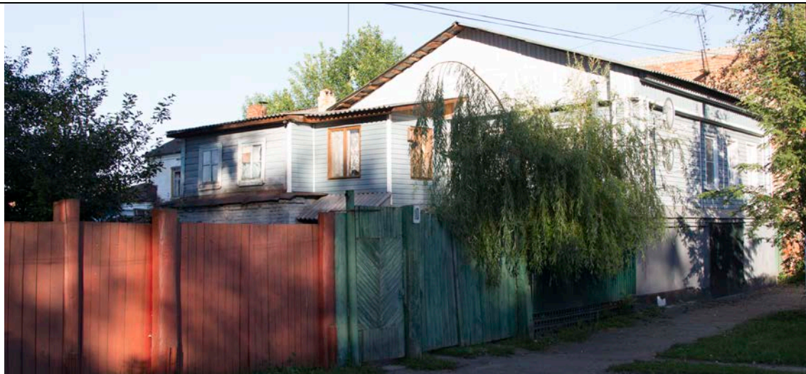
Фото 1. Тамбовская область, г. Моршанск, ул. Красноармейская, 10. «Дом жилой». Общий вид с северо-запада.