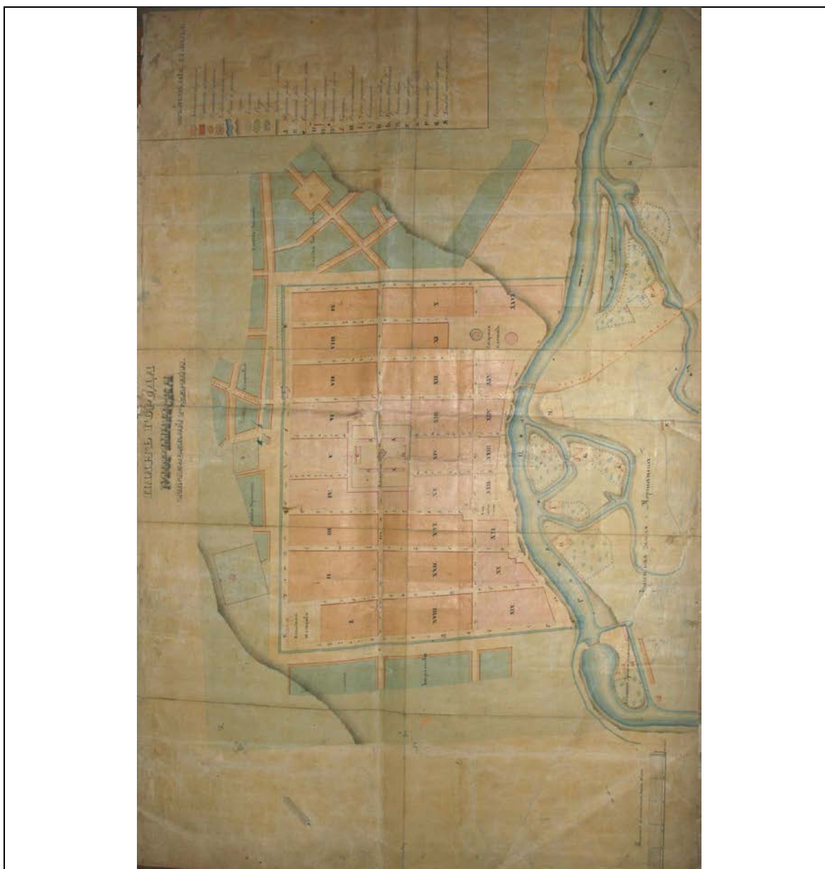
Рис. 1. План города Моршанска XIX в.

Иллюстрации к историко-библиографическим, архитектурным и архивным исследованиям объекта культурного наследия «Дом жилой», по адресу: Тамбовская область, г. Моршанск, ул. Красноармейская, 10.