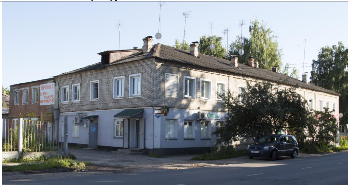
Фото 1. Тамбовская область, г. Моршанск, ул. Лотикова, 72. «Здание общественного назначения». Общий вид с севера. Фасад по ул. Лотикова. Фото от 26.07.2017 г.