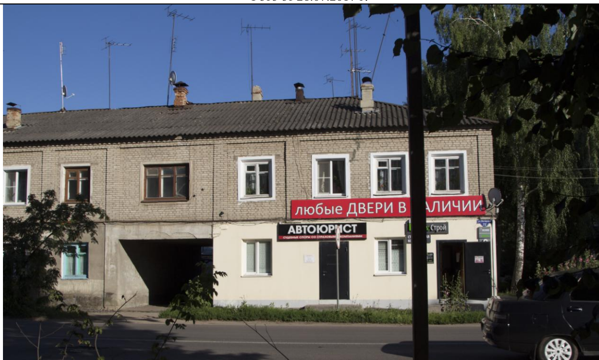
Фото 2. Тамбовская область, г. Моршанск, ул. Лотикова, 72. «Здание общественного назначения». Главный фасад, вид с северо-запада. Фото от 26.07.2017 г.