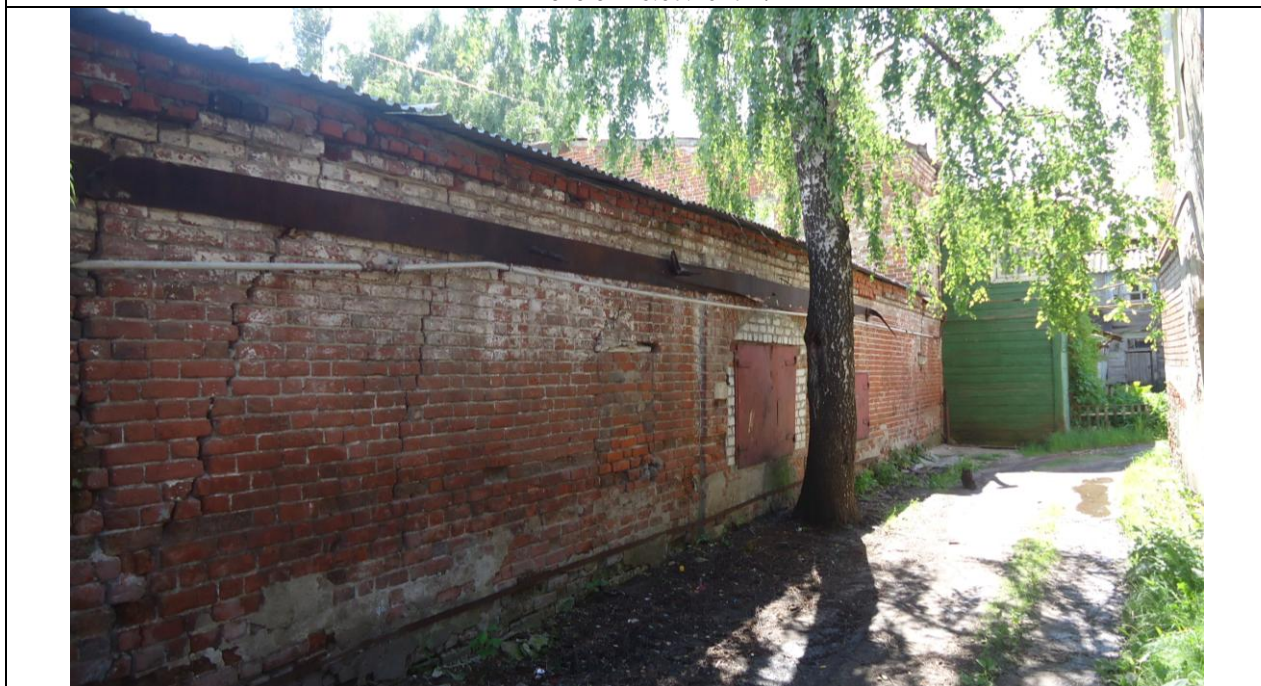
Фото 2. Тамбовская область, г. Моршанск, пл. Октябрьская, д.14-а. «Флигель городской усадьбы». Дворовый фасад. Фото от 26.07.2017 г.