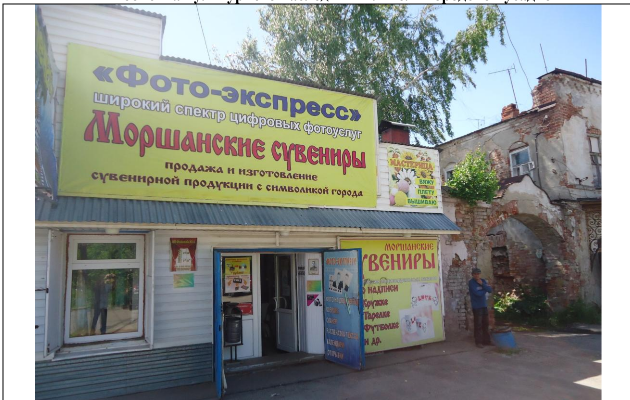
Фото 1. Тамбовская область, г. Моршанск, пл. Октябрьская, д.14-а. «Флигель городской усадьбы». Общий вид с северо-востока. Фасад главный по пл. Октябрьская. Фото от 26.07.2017 г.